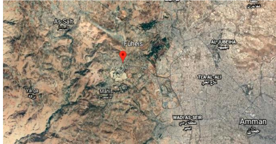
الشكل 2 الموقع الجغرافي لمدينة الفحيص

الفحيص مدينة أردنية ضمن تقع في محافظة البلقاء، تتوسط مدينتي عمّان والسلط وتبعد عن المدينتين أقل من 13 كم، وترتفع 850 مترا عن سطح البحر مما يجعلها أحد مصايف الأردن. يبلغ عدد سكان الفحيص اليوم 20,000 نسمة. تعاني البلدة الوداعة بصورة مستمرة من أكبر مصانع الاسمنت في الأردن المقام على أراضيها.